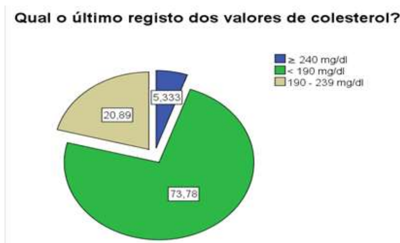
Gráfico 1 – Valores de colesterol total indicado por indivíduo inquirido (%)

Quando questionados sobre a frequência em que faziam a monitorização dos valores de colesterol total, as respostas obtidas foram sobretudo bianualmente (16%), anualmente (36%) ou quando tinham consulta médica (24,9%). Ainda, quando questionados sobre a utilização de medicamentos para o tratamento da hipercolesterolemia, 72% dos inquiridos com os níveis elevados de colesterol referiu utilizar a sinvastina, um medicamento com indicações terapêuticas para o tratamento da hipercolesterolemia, inibidor da enzima HMG-CoA redutase.